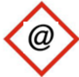
Alerte par mail dès mise à jour FDS