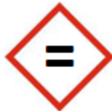
Mise à jour permanente